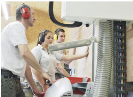
... sowie Treppen. Nicht nur beim Grobzuschnitt an der stehenden Plattensäge entstehen Späne und Staub.