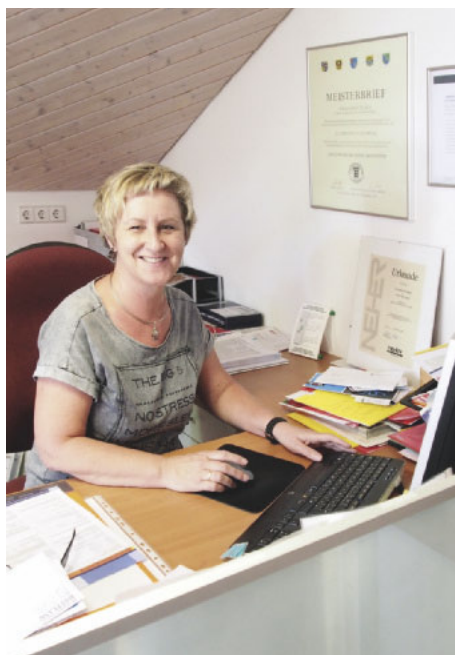
/ Seine Frau Sylvia hat das Büro im Griff und durch ihren Einsatz die maximale Förderung rausgeholt.

Dachboden blieb – unten kühlte der Arbeitsraum aus. Moderne Modelle halten die gesetzlichen Staubemissionswerte natürlich ein. So auch die Power Unit: Die warme, gefilterte Luft wird jetzt über einen Rückluftkanal in die Werkstatt zurückgeführt.