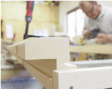
Die Schreinerei Bottlang arbeitet viel mit Massivholz, fertigt vor allem Möbel, aber auch Türen und Zargen ...